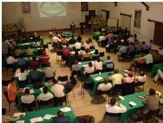
Jornadas de trabajo