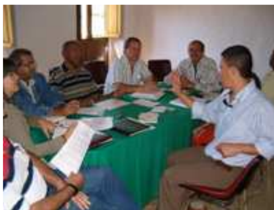
Mesa de trabajo