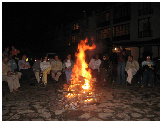
Noche de integración