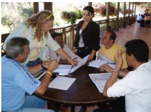
Organización del plan de acción a partir de los instrumentos presentados