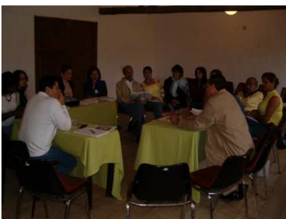
Equipo base de Asesoría y Asistencia Técnica de la Secretaría de Educación para la Cultura de Antioquia