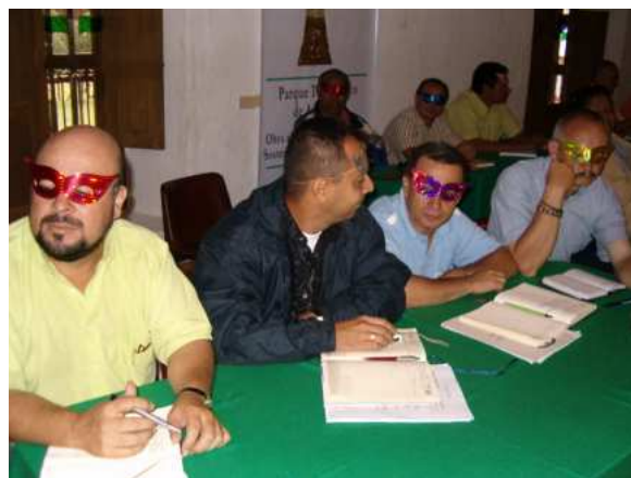
Redización, taller de Desarrollo Humano