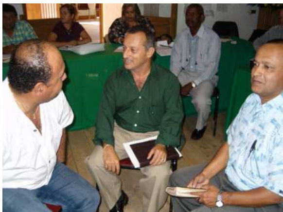
Desarrollo del taller de recreación del concepto de Asesoría y Asistencia Técnica