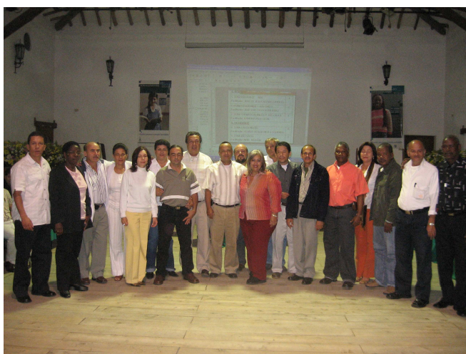
Equipo de facilitadores Zonales